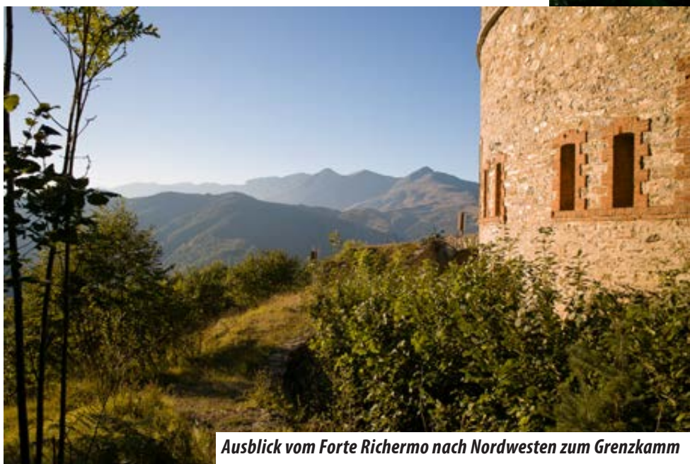
Ausblick vom Forte Richermo nach Nordwesten zum Grenzkeamm

Forte hat man einen schönen Blick nach Westen zum Forte Possanghi, Tour 2, und weiter bis zum Colle Garezzo und dem Ligurischen Grenzkeamm.