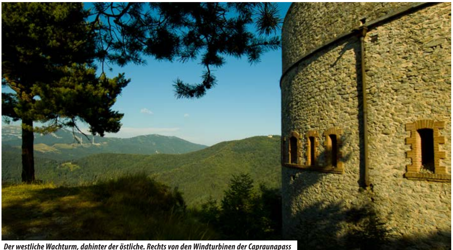
Der westliche Wachturm, dahinter der östliche. Rechts von den Windturbinen der Capraunapass