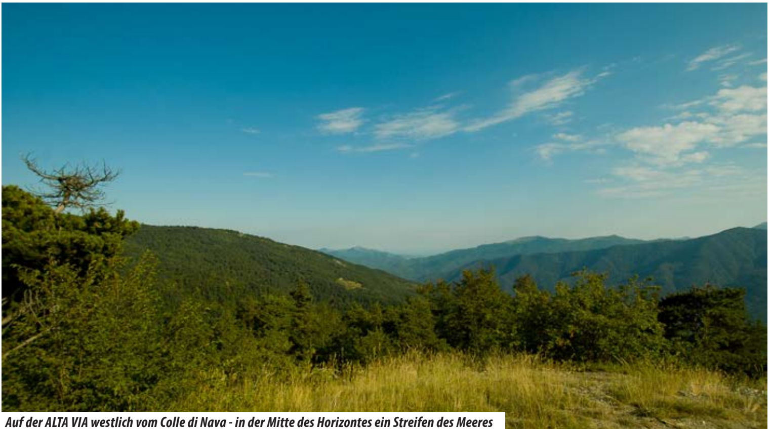
Auf der ALTA VIA westlich vom Colle di Nava - in der Mitte des Horizontes ein Streifen des Meeres

Über den Colle di Nava führt die wichtige Passstrasse welche die ligurische Küste (Imperia/Albenga) mit dem Piemont verbindet. Von Norden kommend verlässt man die Autobahn Torino - Savona in CEVA und fährt durch das Tanarotal über Ormea auf den Pass. In \frac{3}{4} Stunden erreicht man von hier die ligurische Küste. Der Höhenwanderweg, die ALTA VIA von Ventimiglia nach Spezia, zieht direkt über den Pass. Östlich und westlich dieser Linie öffnet sich ein spannendes einsames Gebiet mit unendlichen Wäldern, alten Strassen, Mulatieris und Bergdörfern. Westlich beginnt alsbald der bekannte Ligurische Grenzkamm zum französischen Gebiet. Für jeden Typ von Radfahrer und Wanderer gibt es in diesem Landstrich eine Vielzahl von verschiedenen Touren.