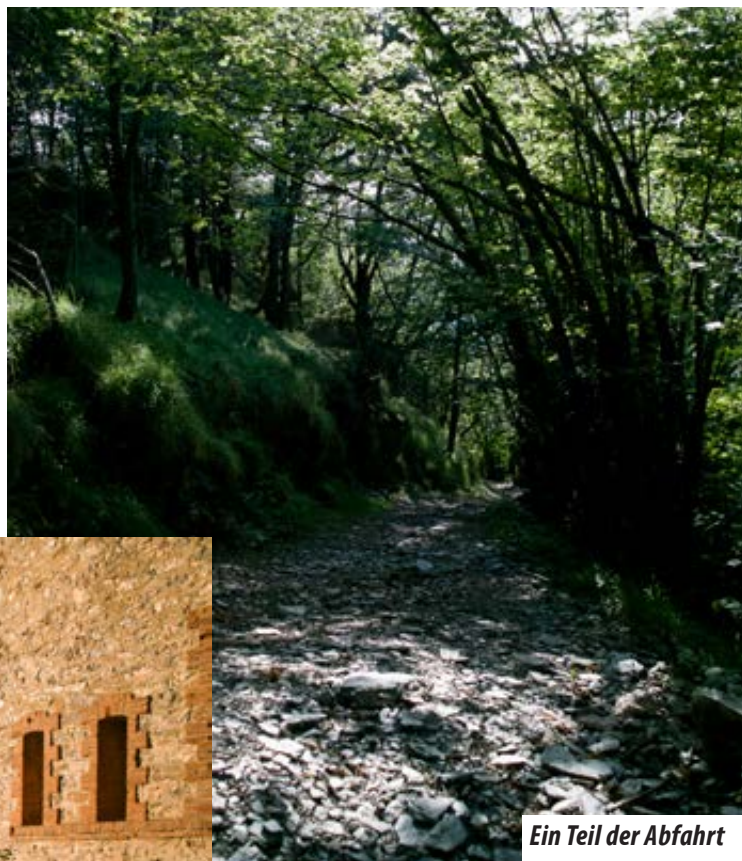
Ein Teil der Abfahrt

Start: Vom grossen Parkplatz auf asphaltierter Strasse zum Colle San Bernardo d'Armo hinauf. Kurz vor dem höchsten Punkt rechts ab, zuerst über eine Wiese zum Fussweg welcher über den bewaldeten Kamm ( Cima Le Vegaudi ) zum Forte führt. Mit zwei, drei kurzen steilen Schiebbestücken erreicht man den Turm. Kurz vor dem Turm erkennt man den Abfahrtsweg. Beim